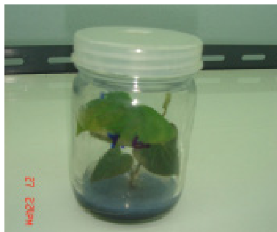
Figure 3. Shoot development after cultured on MS+BAP 1.5 mg/L. for eight weeks