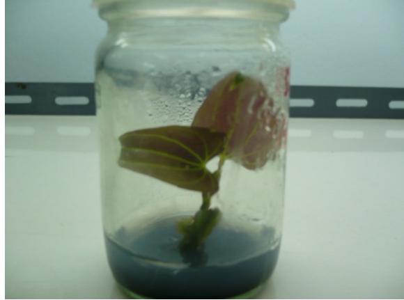
Figure 2. Shoot development from lateral node after surface disinfection for 10 days.