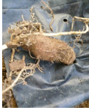
Figure 1. Dioscorea alata L. planted in growth material . (A) stem and leaves, (B) tuber